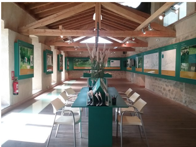
Vista general de la exposición, planta 1