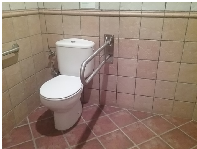
Aseo adaptado de mujeres