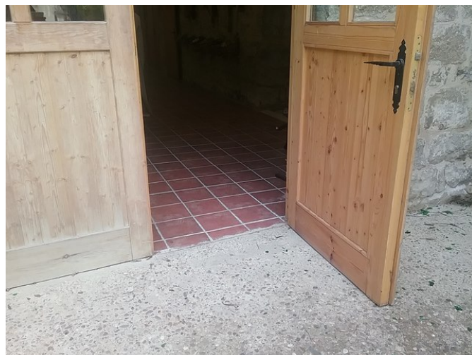
Acceso alternativo sin desniveles