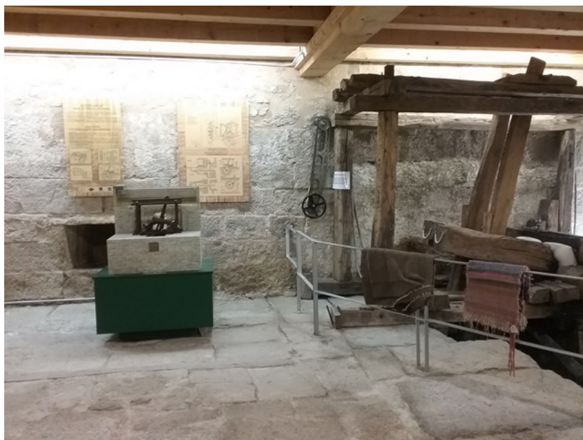
Batán y maqueta del mismo